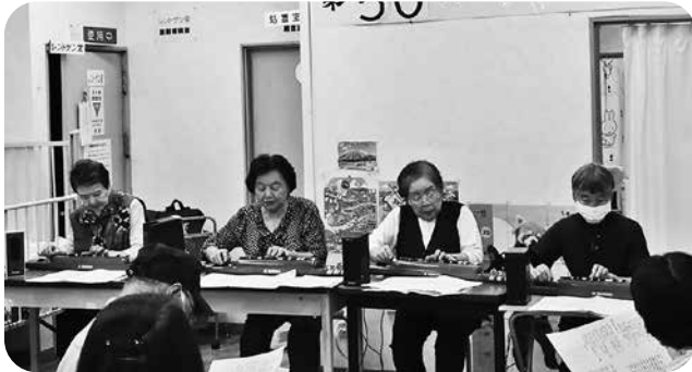
大正琴サークルの演奏

別紙で2025年活動方針を抜粋して入れさせていただきます。ご覧いただければ幸いです。