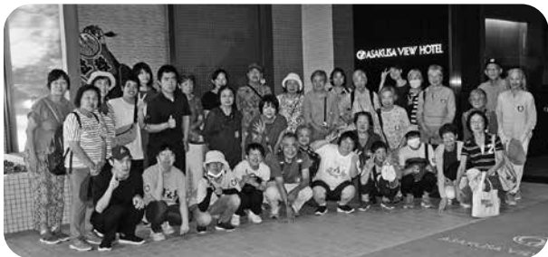
浅草ビューホテル