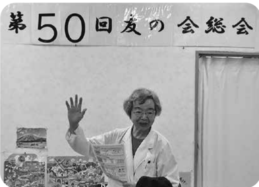
带状疱疹について説明する細山所長