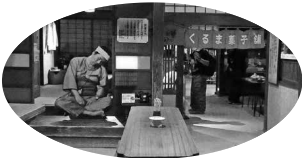
寅さんミュージアム